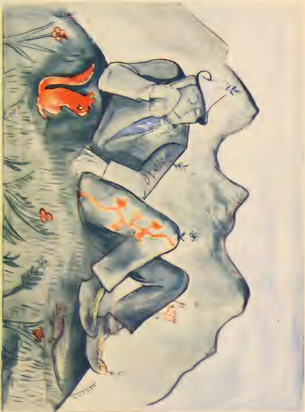
ליגה ער א שייך פארוואקסן מיט גרויסעם גראפן מאד.